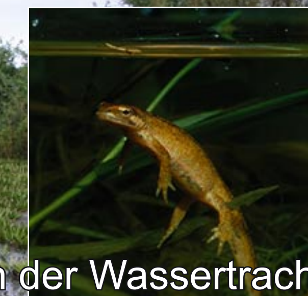
Teichmolch in der Wassertracht