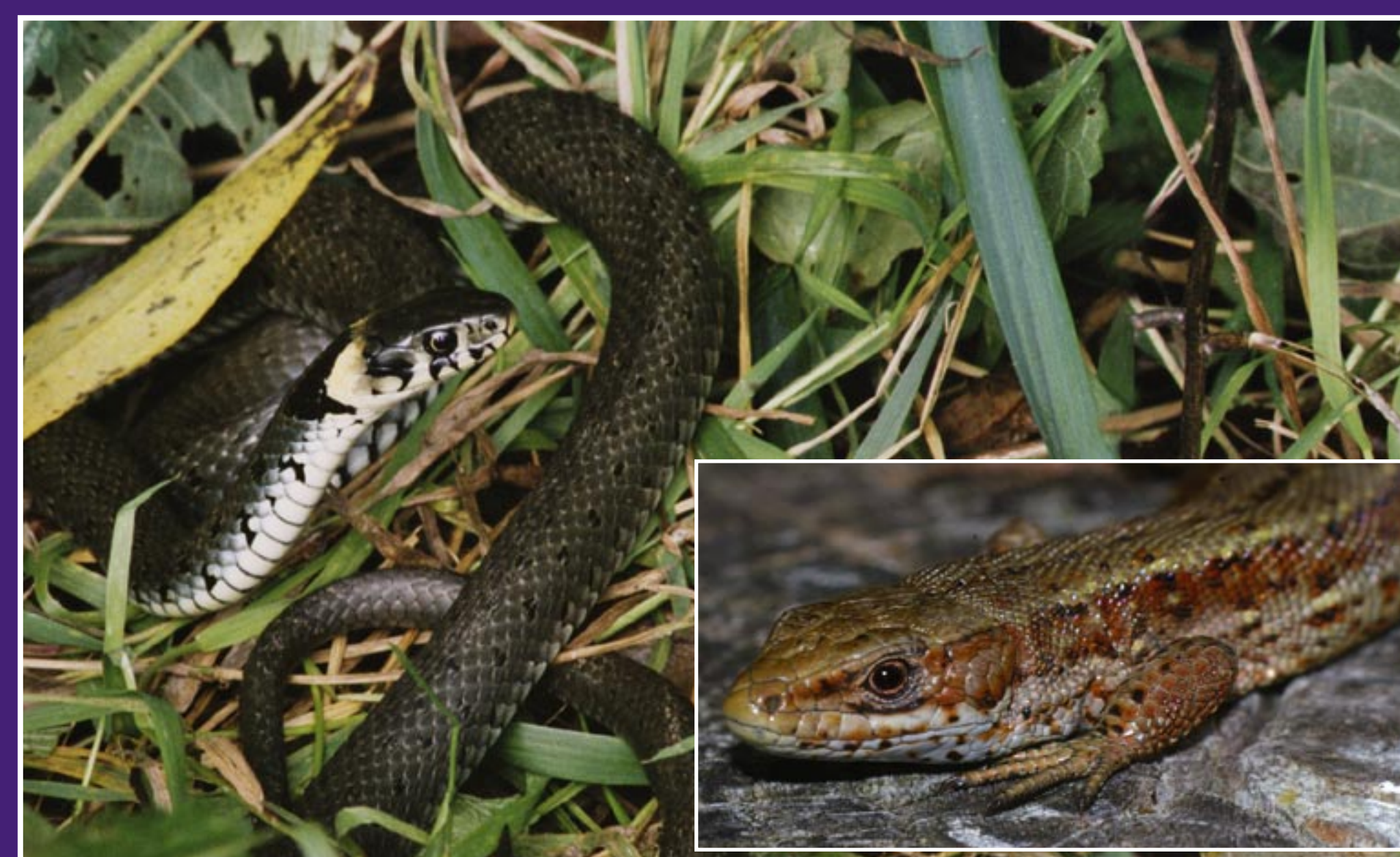
Ringelnatter (links) und Waldeidechse