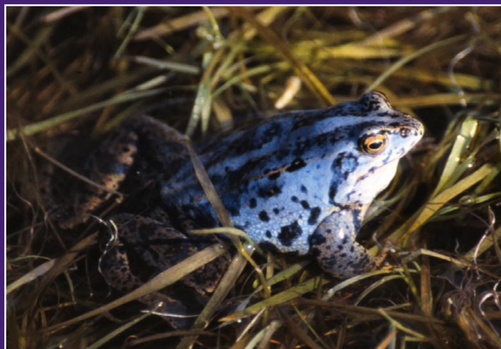
Das Moorfroschmännchen nimmt nur zur Paarungszeit im Frühjahr eine blaue Färbung an.

inzwischen rund 18 ha groß und beherbergt viele geschützte Tier- und Pflanzenarten. Zweimal im Jahr wird die Straße jeweils ca. 6 Wochen lang für den Autoverkehr gesperrt, um den Kröten und Fröschen ein gefahrloses Zu- und Abwandern zu ermöglichen.